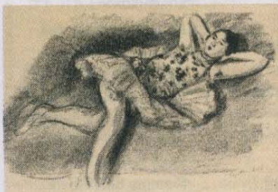
Danseuse étendue au divan, de Matisse.