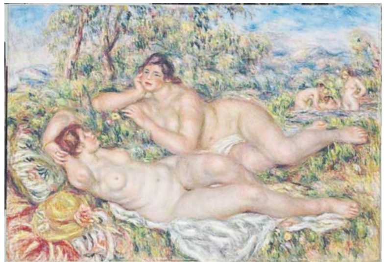
Renoir: 'Las bañistas' (1918-1919). Este cuadro puede verse actualmente en la exposición de la Fundación Mapfre en Barcelona

Un evidente ejemplo de arte y vejez: en 1973 y en el Palacio de los Papas de Aviñón, se exponían las últimas obras de Picasso, escogidas por él mismo antes de morir. Ante el desconcierto y el embarazo silencio de la crítica, un Picasso despojado, feroz y urgente, apresurado, desafiante y sublime. Los temas de siempre: toreros, mujeres, mosqueteros, la figura del pintor decrepito pintando... una revisitación esencial. Eros y Tánatos. Un erotismo oscuro, obscuro y descarnado -¿desengañado?- . Vaginas dentadas, ojos desor-