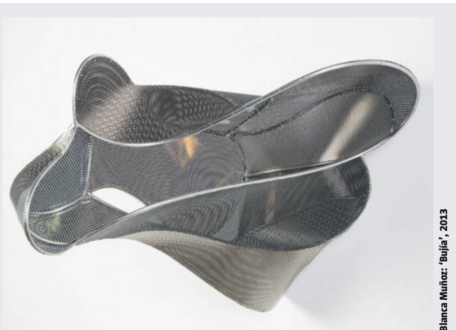
Blanca Muñoz: 'Bujía', 2013