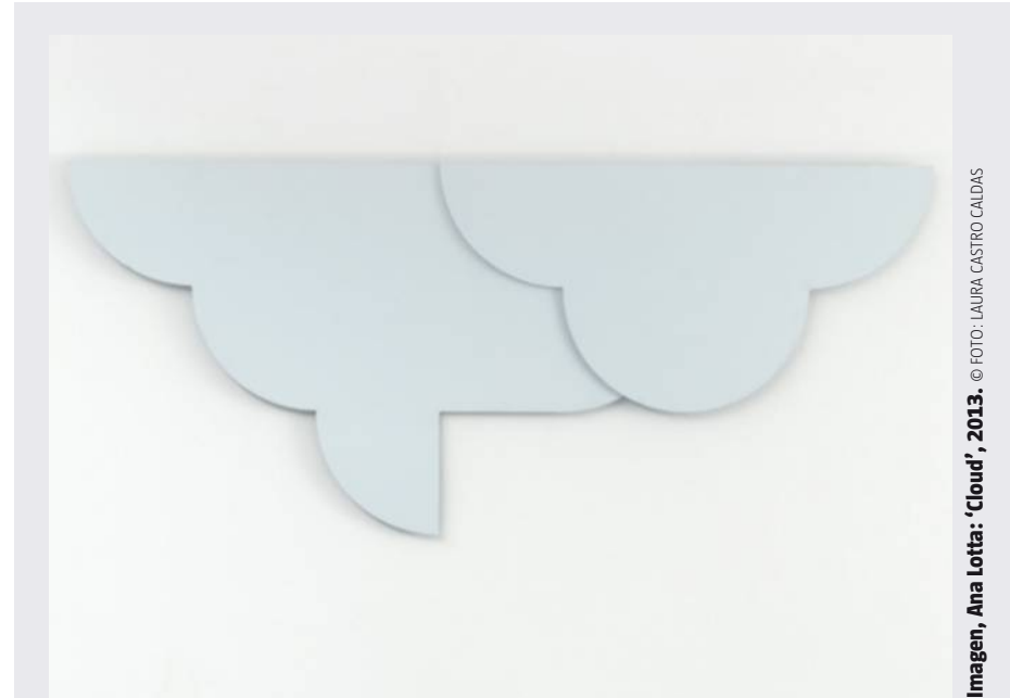
Imagen, Ana Jotta: 'Cloud', 2013.

No todo se acaba el 2 de octubre. Otra novedad destacada de esta temporada es la inclusión de nuevos espacios en el mapa expositivo de la ciudad. Confirmándose la tendencia iniciada hace varios años, que ha abierto un debate cada vez más encendido sobre la gentrificación, los galeristas se aventuran a descubrir y revitalizar zonas nuevas. Es el caso de LAB36, el espacio experimental de la galería Senda en la calle Trafalgar que ha empezado la temporada con un nombre destacado, el de Chus Martínez. La comisaria y directora del Instituto de Arte de la Academy of Art and >