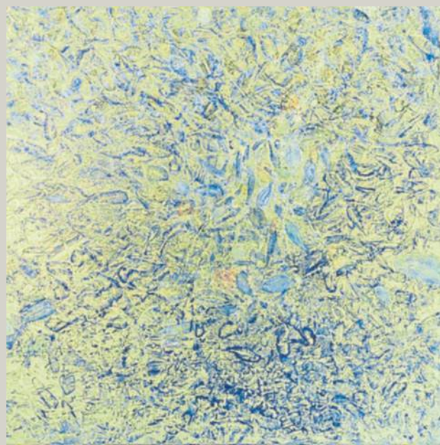
Imagen, Rafel Joan: 'Peixes joves'

Una de las galerías que más defienden las nuevas expresiones del arte presenta el proyecto del artista conceptual Pep Agut (Terrassa, 1961), una reflexión sobre la relación existente entre el trabajo de Penélope, los viajes de Ulises y la trayectoria del propio Agut, así como sobre los resultados obtenidos por todos ellos. Del 29 de septiembre al 18 de noviembre. www.angelsbarcelona.com